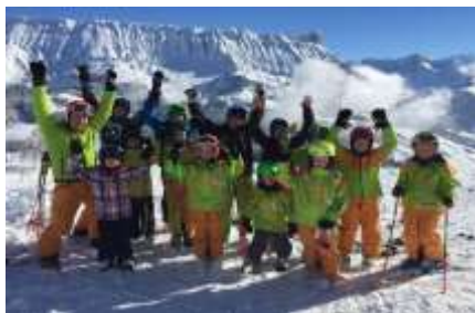
Skitraining auf der Marbachegg, 12.11.2016

Vom 18.-20.11.2016 und vom 09.-11.12.2016 konnte die JO Escholzmatt wieder zwei Trainingslager in Andermatt durchführen. Dieses Mal spielte das Wetter mit. Die Kinder trainierten fleissig und intensiv und hatten sichtlich Spass. Im Dezember und Januar liess der Schnee in der Region auf sich warten. Mit Improvisation und Umplanungen konnten wir nur reduziert in Sörenberg, Andermatt oder auf dem Titlis trainieren.